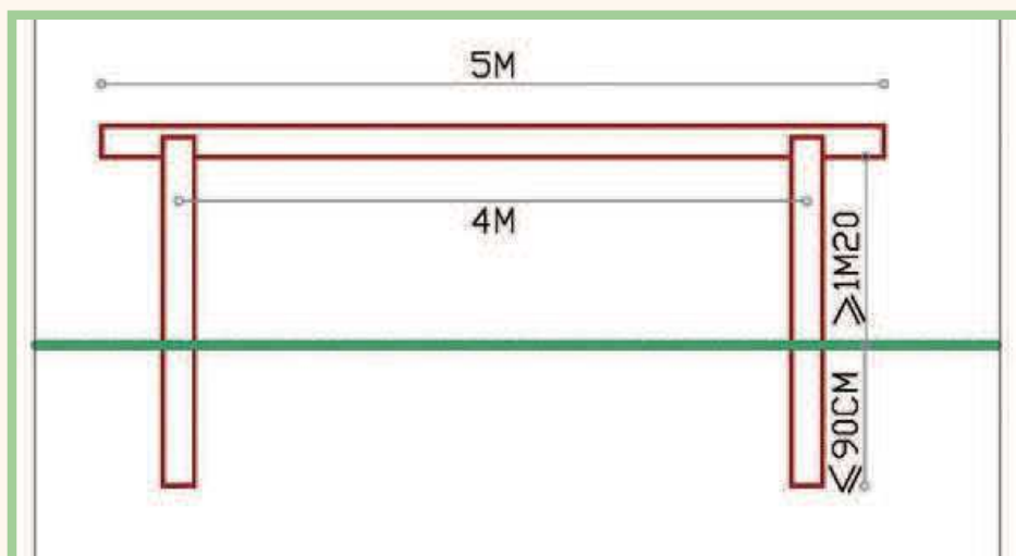
Dessin Laurence VanDam

Bien que nous sachions tous que les crottins font le bonheur des petits oiseaux, un ramasse-crottin à disposition permettra d'écarter ce sujet de controverse du chemin des autres clients